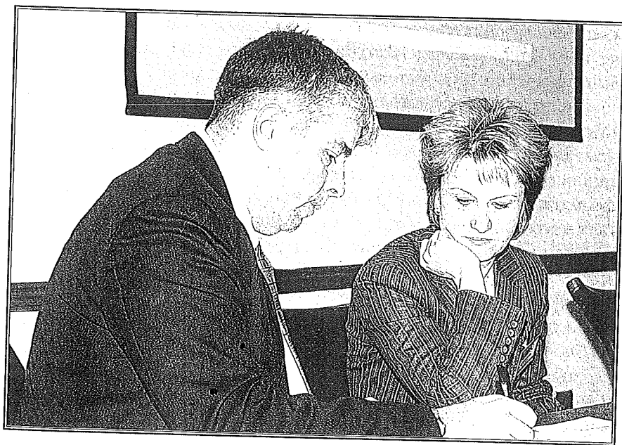
Последние наброски перед выступлением

Пятое пленарное заседание было полностью посвящено вопросам бюджетирования в системе